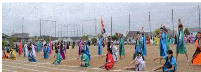
成小ソーラン ～伝統継承～