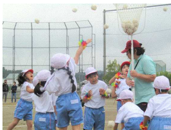
ジャンボリ 玉入れ