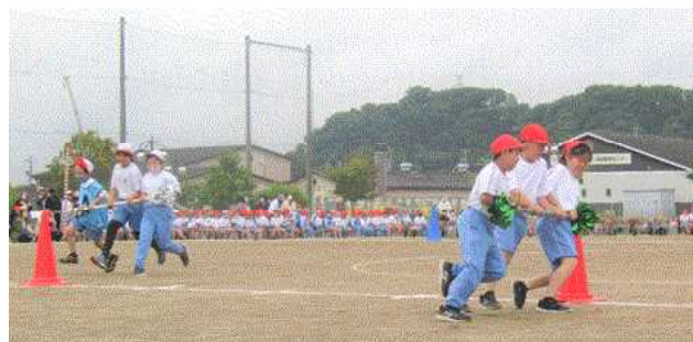
ぐるぐるタイフーン