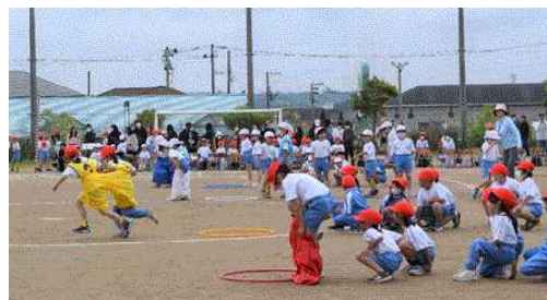
2人でなかよく！～デカパンリレー～